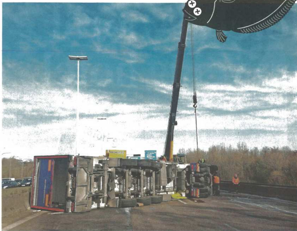
● Een vrachtwagen kantelde op de Brusselse buitenring, die urenlang afgesloten was. De verse vis uit de truck werd in allerijl naar een Franse markt afgevoerd.

● kost voor de samenleving: 1,5 miljoen euro