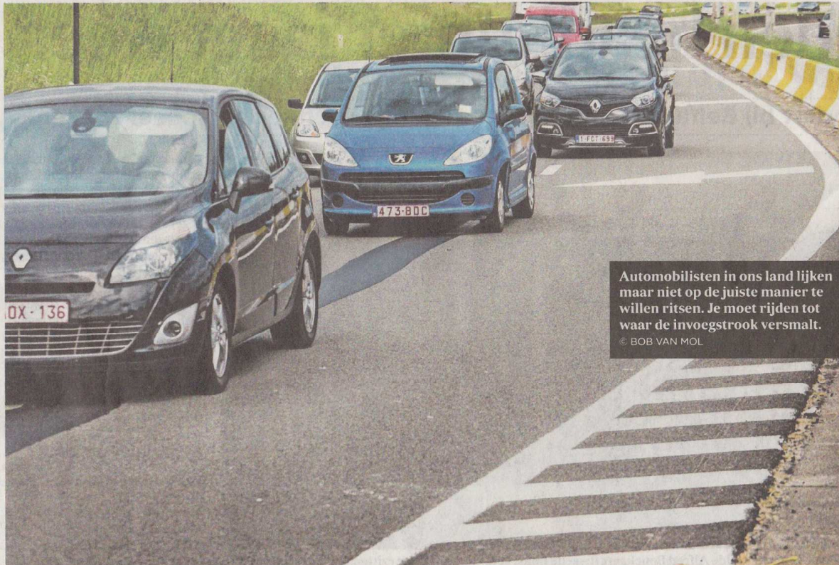
Automobilisten in ons land lijken maar niet op de juiste manier te willen ritsen. Je moet rijden tot waar de invoegstrook versmalt.